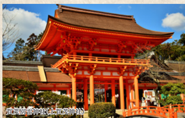
賀茂御祖神社(上賀茂神社)