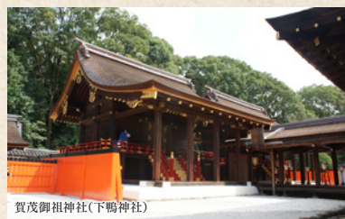
賀茂御祖神社(下鴨神社)